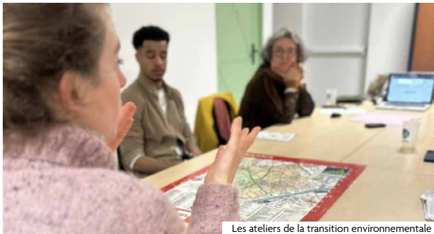
Les ateliers de la transition environnementale