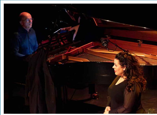
Spectacle à L'étoile • Scène de Mouvaux : Lost in love