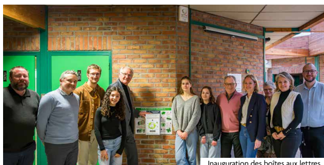
Inauguration des boîtes aux lettres

L'automne a également été très actif pour les membres du CMJ, qui ont assuré les séances d'inscription à la Braderie des Jeunes du 24 novembre. Une première à Mouvaux, qui s'est révélée être un véritable succès, avec de nombreux jeunes exposants et une forte affluence de visiteurs. Certains étaient aussi mobilisés la veille, lors du Forum de la Famille, où ils ont endossé le costume de Flic Flac et Bzz Bzz, les mascottes adorées des petits Mouvallois. Enfin, ils se sont relayés dans l'un des chalets du Marché de Noël pour vendre des gâteaux et des cartes postales stylisées représentant les principaux monuments de Mouvaux, au profit de l'Unicef.