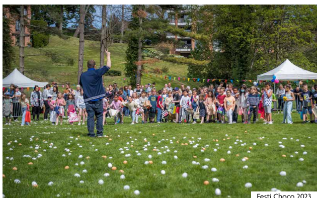
Festi Choco 2023

Programme de l'évènement : www.mouvau.fr