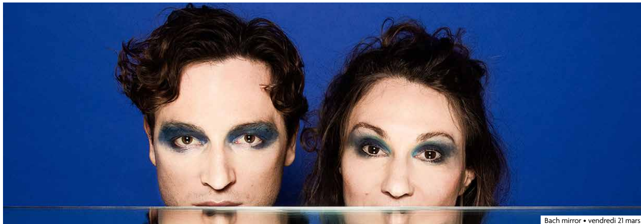
Bach mirror • vendredi 21 mars

Deux rendez-vous de la programmation "Ville" de L'étoile vont vous permettre de vivre un moment exceptionnel et un temps tout en douceur. Il s'agit du concert Bach Mirror et de la projection du film Le Petit Prince.