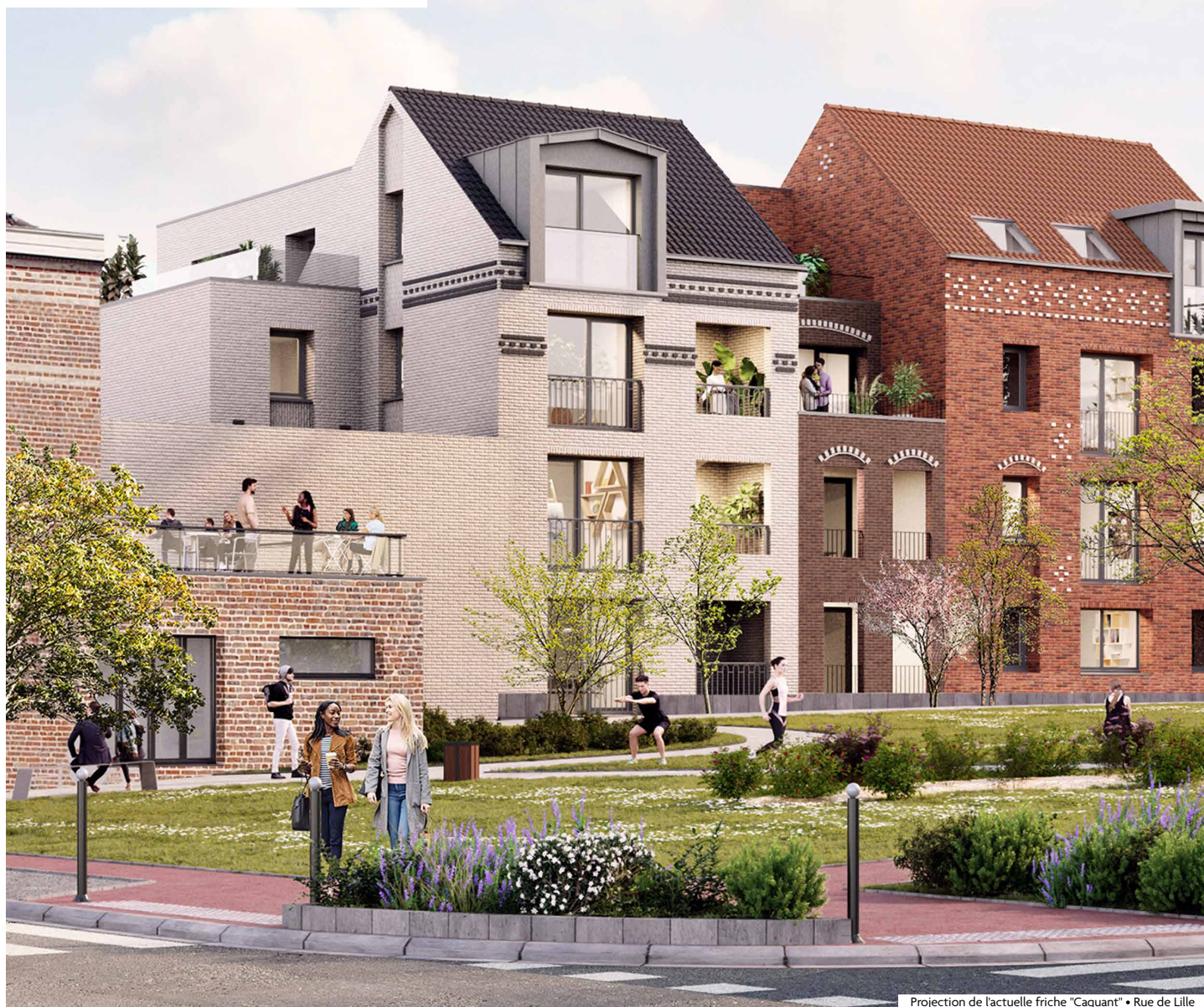
Projection de l'actuelle friche "Caquant" • Rue de Lille

PAGE 07 CONSEIL MUNICIPAL DES JEUNES : NOS JEUNES S'ENGAGENT