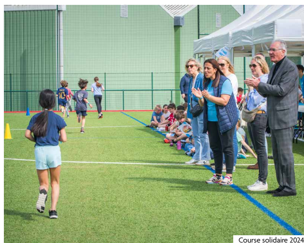
Course solidaire 2024

Le 4 avril aura lieu la course solidaire organisée par la Ville pour les CM1-CM2 des écoles mouvallaises et les 6 e du collège Maxence Van der Meersch, au complexe sportif Pierre de Coubertin. Près de 500 élèves y participeront. Chaque classe est invitée à choisir une cause à défendre (éducation, égalité filles-garçons, vaccination, nutrition, accès aux médicaments) et devra se rendre sur le lieu de la course lors d'un créneau précis. Les enfants formeront des binômes : l'un des deux courra, tandis que l'autre comptera le nombre de boucles parcourues (200 mètres) pendant le quart d'heure imparti. Ensuite, ils échangeront leurs rôles. Des représentants de l'Unicef seront présents pour les informer sur les droits des enfants. Les écoliers et collégiens auront également été sensibilisés en amont et seront invités à récolter des fonds pour l'Unicef. L'année dernière, la course a rapporté près de 1 000 € à l'association !