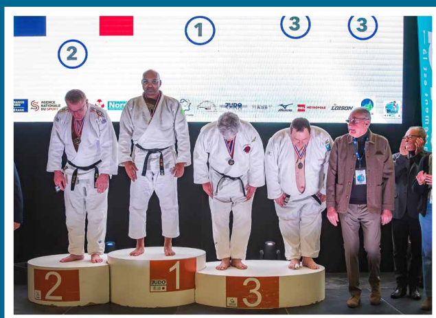
Eurométropole masters de judo