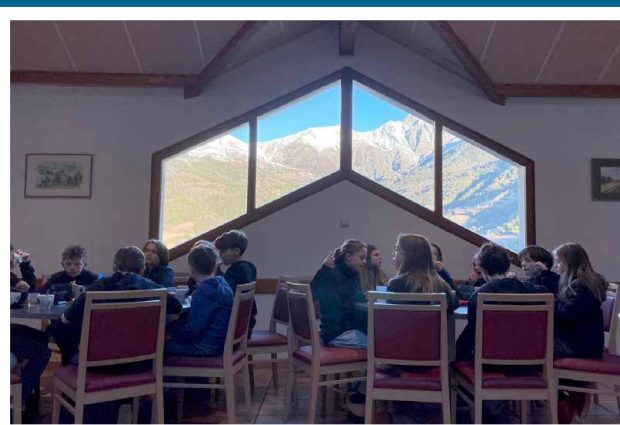
Classes de neige