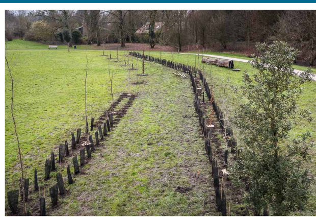
Nouveau sentier forestier, Parc du Hautmont