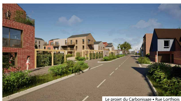
Le projet du Carbonisage • Rue Lorthiois

Le caractère verdoyant de Mouvaux contribue à son attractivité au sein du territoire métropolitain. Tout en redonnant vie à des espaces abandonnés par le temps, il s'agit d'inscrire cet ADN mouvallois dans chacun des nouveaux projets. La réhabilitation des friches devient alors une véritable opportunité pour revitaliser les quartiers mais aussi les renaturer. Ainsi, une friche industrielle, entièrement bétonnée et donc imperméabilisée, est en partie convertie en un véritable îlot de biodiversité, proposant des espaces paysagers et plantés de qualité. Ces derniers contribuent non seulement à structurer le paysage, à embellir nos quartiers mais également à étoffer la trame verte de la Ville, donc à offrir des corridors de déplacement, de nourriture et d'habitat à la faune. La dimension environnementale des nouveaux espaces paysagers est également essentielle face au réchauffement climatique. En effet, les surfaces plantées augmentent l'infiltration des eaux pluviales lors de fortes précipitations, évitant ainsi la saturation des réseaux. Elles permettent également de tempérer les quartiers en luttant contre les îlots de chaleur urbains. Le principal défi réside dans la capacité à intégrer cette nature au sein de la diversité architecturale qui fait la richesse de Mouvaux. Chaque projet est ainsi conçu en harmonie avec le tissu urbain qui l'accueille.