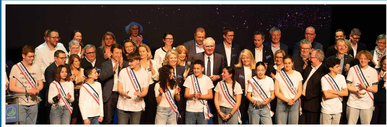
Cérémonie des Vœux