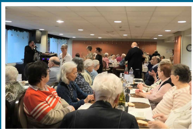
Banquet Vallon Vert