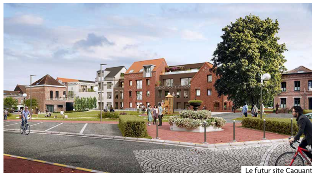
Le futur site Caquant

que les générations passées ont œuvré à construire. Dans ce même esprit de préservation et de transmission, la commune a impulsé le classement du Grand Boulevard en Site Patrimonial Remarquable (SPR).