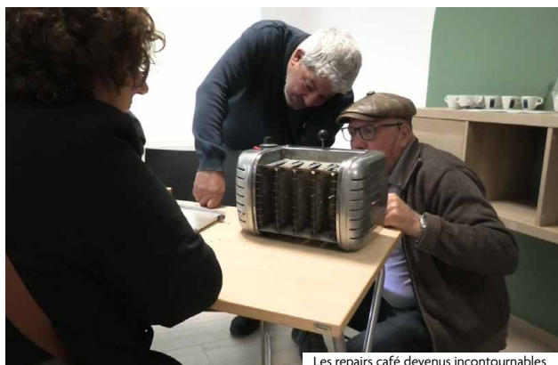
Les repairs café devenus incontournables