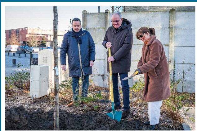
Inauguration nouvelle aire de stationnement paysagère