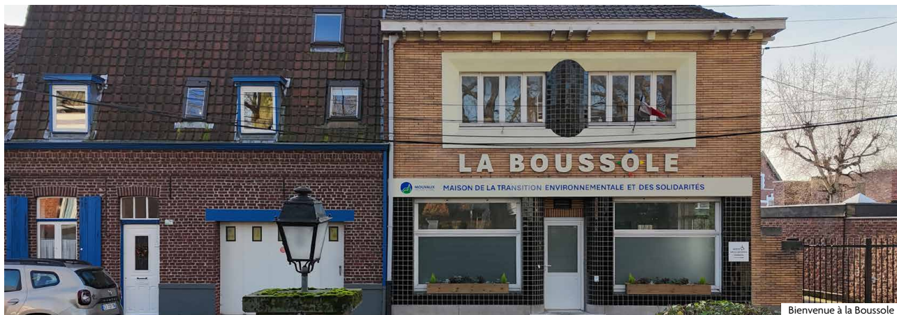
Bienvenue à la Boussole

Mouvaux s'engage dans la transition environnementale avec une feuille de route claire : l'Agenda 2030. Il décline l'action durable et responsable de la commune à travers 4 objectifs symbolisés par une boussole. Focus sur l'un d'eux : Ve comme Vivre ensemble.