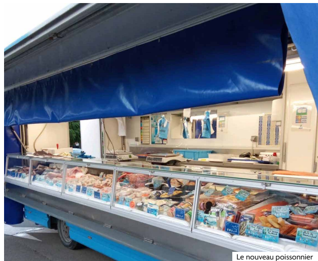
Le nouveau poissonnier

Salon de coiffure masculin 7 rue Mirabeau Tél. : 07 88 62 62 68 Ouvert tous les jours