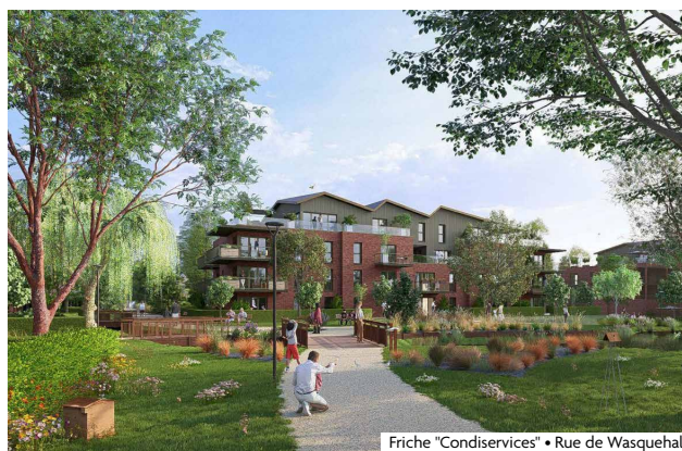
Friche "Condiservices" • Rue de Wasquehal