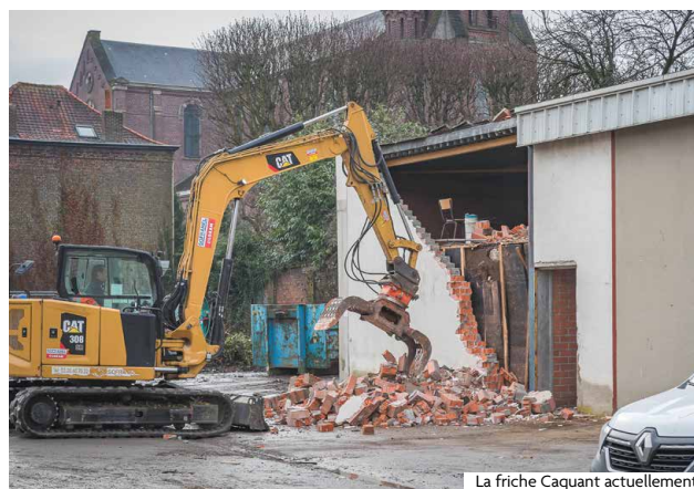
La friche Caquant actuellement

Tous les espaces paysagers longeant le mur à démolir, côté square – qui sera en partie impacté par le chantier – seront recomposés. Les travaux de démolition ont démarré, et la livraison est prévue pour 2027.