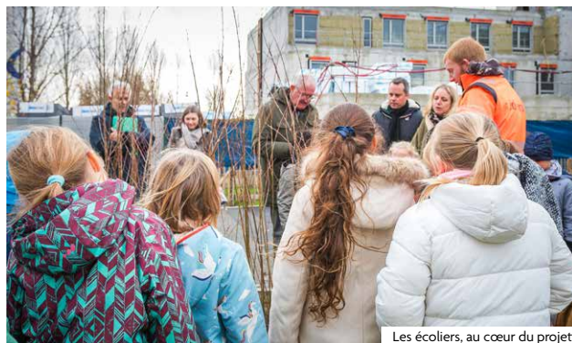
Les écoliers, au cœur du projet