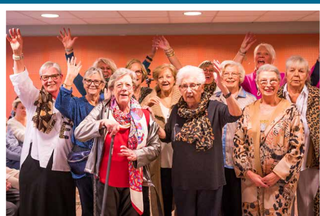
Défilé de mode au VallonVert