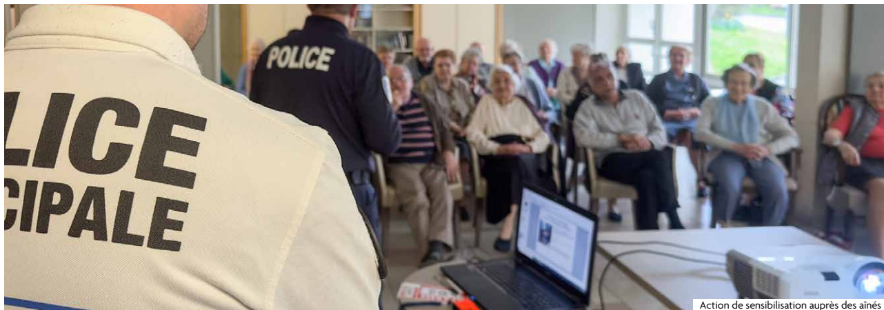
Action de sensibilisation auprès des aînés

En déployant un réseau de vidéoprotection de 70 caméras, en mobilisant une équipe de 10 policiers municipaux, en développant des dispositifs comme « Mouvaux Vigilance » mais aussi des actions de préventions auprès des plus jeunes, la Ville s'emploie de façon active et quotidienne à garantir la sécurité de tous... au regard de ses prérogatives.