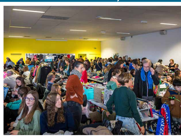
1 re braderie des jeunes du CMJ