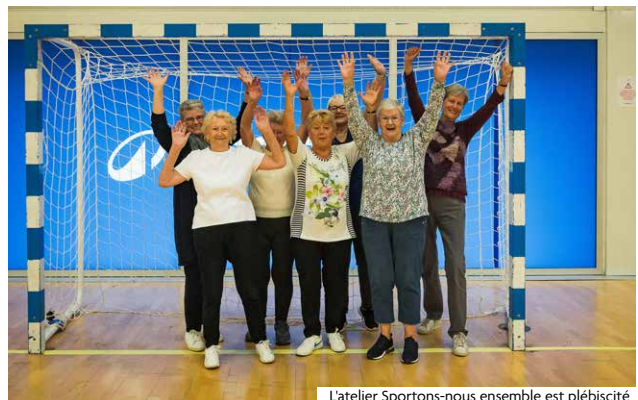
L'atelier Sportons-nous ensemble est plébiscité