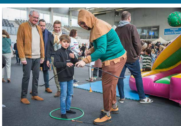
Forum de la Famille