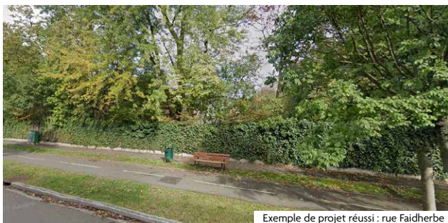
Exemple de projet réussi : rue Faidherbe