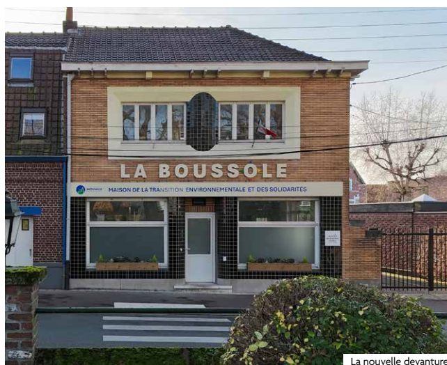
La nouvelle devanture

Les ateliers du service de Transition environnementale se tiennent désormais, pour la plupart, dans les locaux de La Boussole. Entièrement rénovée par les services municipaux de la Ville, cette salle bénéficie d'une isolation performante, d'un éclairage LED moderne, et d'une nouvelle chaudière, offrant ainsi un confort optimal aux participants. Une signalétique récemment installée vient parachever ces améliorations, transformant La Boussole en un lieu accueillant et fonctionnel pour les Mouvallois désireux d'approfondir leurs connaissances en matière de Transition environnementale. Cet espace abrite également les activités du Centre Communal d'Action Sociale (CCAS), qui a centralisé ses propres ateliers à La Boussole (pour plus d'informations, voir page 16). Une synergie bénéfique qui fait de La Boussole un véritable pôle de rencontres et d'échanges au service des Mouvallois et du vivre-ensemble.