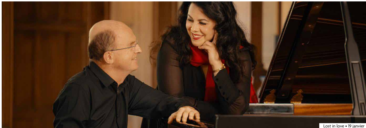
Lost in love • 19 janvier

Continue avec du théâtre et de la musique