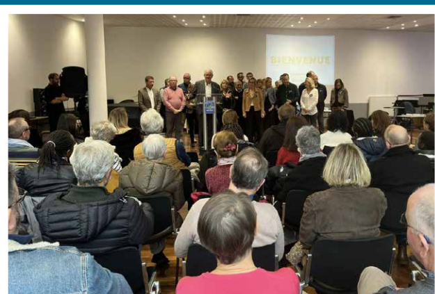
Cérémonie des nouveaux Mouvallois