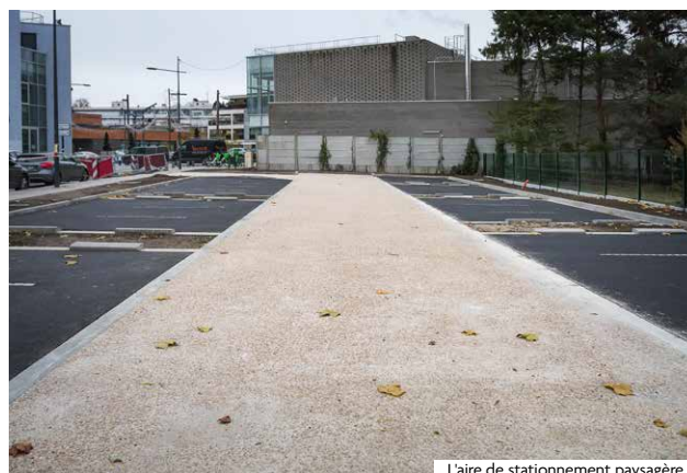
L'aire de stationnement paysagère

Inscrite dans la démarche d'embellissement et de dynamisation du Cœur de Ville, cette aire paysagère allie confort, mobilité douce et respect de l'environnement. Son cadre verdoyant sera enrichi prochainement par la plantation d'arbres et de massifs. Cette démarche s'inscrit également dans le cadre du remplacement des arbres malades abattus sur les conseils de l'Office Nationale des Forêts.