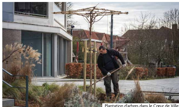
Plantation d'arbres dans le Cœur de Ville

Enfin, la gestion des espaces verts doit limiter les émissions de gaz à effet de serre, préserver l'eau (récupérateurs d'eau pluviale) et s'adapter aux défis climatiques pour un environnement urbain plus durable et agréable.