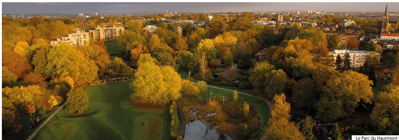
Le Parc du Hautmont

La transition environnementale à Mouvaux a désormais une feuille de route. L'Agenda 2030 est désormais connu de tous. Symbolisé par une boussole, il indique les 4 chemins vers une action pérenne et responsable. 4 chemins, 4 piliers. Voyons plus en détails l'un d'eux : O comme Oasis, le pilier de la Biodiversité.