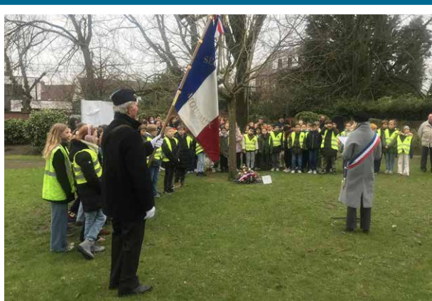
Cérémonie de l'Arbre de la laïcité avec les écoliers