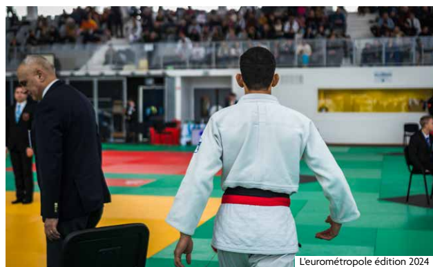
Leurométropole édition 2024

Les horaires peuvent varier selon le nombre de participants.