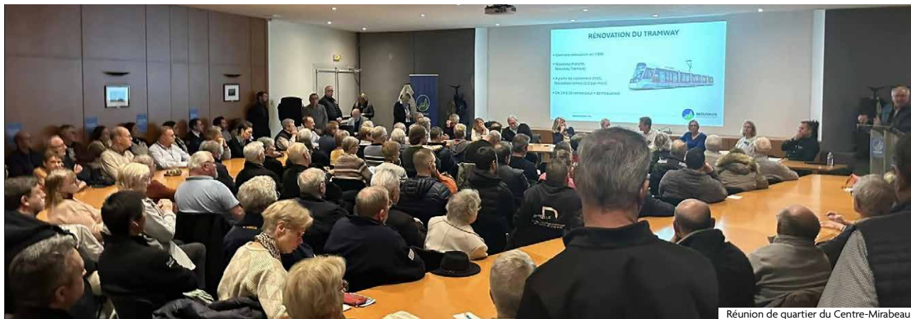
Réunion de quartier du Centre-Mirabeau