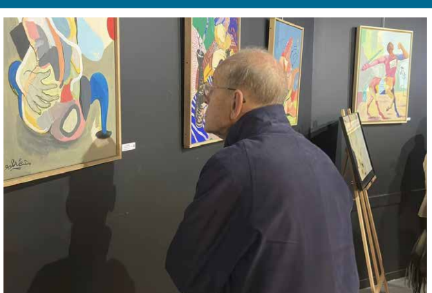
3 e édition du SMARTS