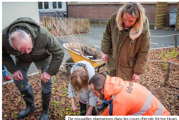
De nouvelles plantations dans les cours d'école Victor Hugo

Jusqu'à récemment, les cours des écoles Victor Hugo étaient entièrement recouvertes de macadam, formant un îlot de chaleur dans un quartier dense. Ce projet de végétalisation a permis de transformer ces espaces en lieux plus verts et durables. Au total, 26 % des surfaces ont été désimperméabilisées, améliorant l'infiltration naturelle des eaux de pluie de 53 %. Cette transformation a également permis d'agrandir les cours, créant des espaces plus agréables pour les enfants. Nos écoliers pourront désormais être sensibilisés, de manière ludique, à l'importance de la nature en Ville, notamment au rôle essentiel des arbres pour la biodiversité et le climat urbain.